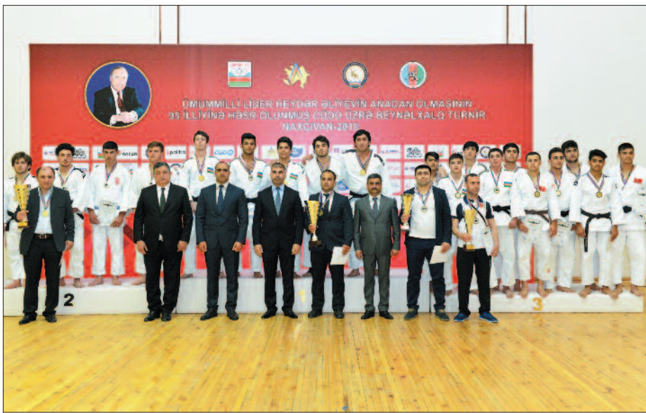
Naxçıvan şəhərindəki İlham Əliyev adına Olimpiya-İdman Kompleksində Azərbaycan Respublikasının və Naxçıvan Muxtar Respublikasının Gənclər və İdman nazirlikləri, Azərbaycan Cüdo Federasiyası və Naxçıvan Muxtar Respublikası Güləş Federasiyasının birgə təşkilatçılığı ilə ümummilli lider Heydər Əliyevin anadan olmasının 95-ci ildönümünə həsr edilən cüdo üzrə beynəlxalq turnir keçirilib.

Turnir iştirakçıları əvvəlcə ümummilli lider Heydər Əliyevin Naxçıvan şəhərinin mərkəzi meydanında əzəmətlə ucalan abidəsini ziyarət edib, Heydər Əliyev Muzeyi ilə tanış olublar.